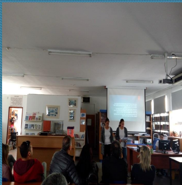
מפגש כתות ט'

תלמידים התבקשו לבחור ספר מהרשימה ולעשות עבודת מצגת בעקבות הקיאה. הדגש הושם על ערכים כגון: חברות, כבוד הדדי, אהבה וכבוד במשפחה, אהבת המולדת, התנדבות, יוזמה, אומץ לב, תלמידים ענו על השאלות: איזה עצה היית נותן לדמות? איזה דמות היית מכניס לספר? כיצד מתקשר האיוור בכריכת הספר לתוכן הסיפור.